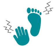
DOLOR EN ARTICULACIONES